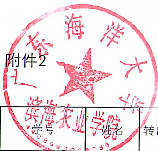
滨海农业学院2022年度转专业转出遴选详情表